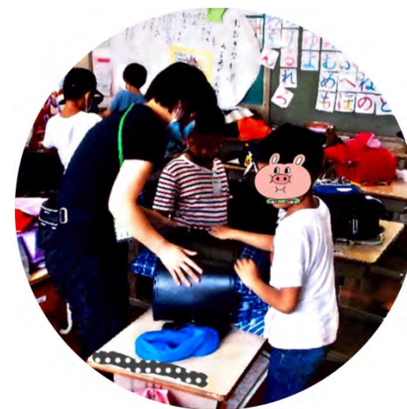
外国籍児童の教育