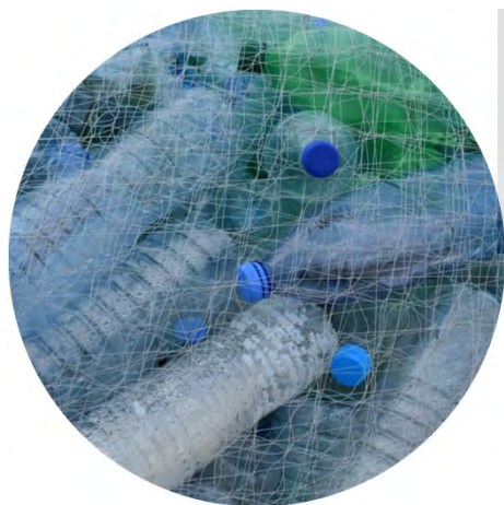
プラスチック問題