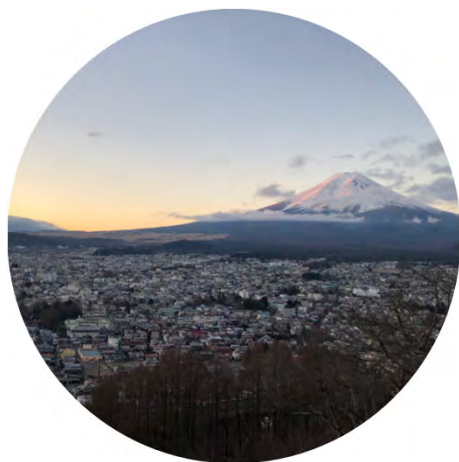
富士山：災害と防災