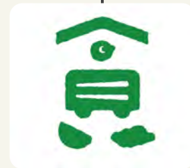
やさいバス食堂(株)