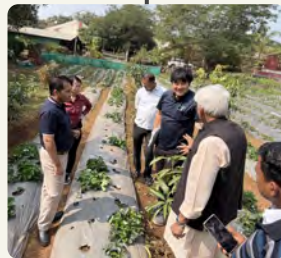
M2Labo Bharat Pvt. Ltd.