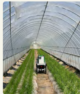
Smart Village Labo